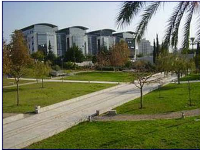
جامعة بار إيلان