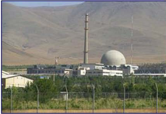
المشروع النووي الإيراني

وترى الدراسة ذاتها أن التواجد الإيراني حول "إسرائيل" هو لمنع "إسرائيل" من الاعتداء على المشروع النووي الإيراني، وإقناع "إسرائيل" بأن الإقدام على فكرة كهذه سيكون له آثاراً هائلة على "إسرائيل" على غرار نموذج الصراع بين الكوريتين.