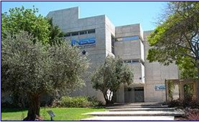
معهد دراسات الأمن القومي الإسرائيلي

تحدد نتائج الدراسة التي أجراها معهد دراسات الأمن القومي الإسرائيلي The Institute for National Security Studies (INSS) تحت عنوان مؤشر الأمن القومي سنة 2019؛ مؤشرات الأمن القومي الإسرائيلي ورؤيتها المستقبلية، وهو ما يسهم في التأثير على التوجهات المستقبلية لصانع القرار الإسرائيلي.